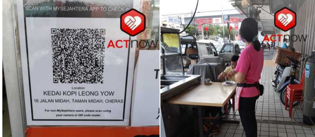
26 Januari 2021, - restoran ini dilaporkan menyajikan makanan kepada pelanggan semasa MCO 2.0. Selepas dilaporkan, Lans Koperal Fatah telah mengunjungi restoran tersebut untuk memberi amaranan yang tegas kepada pemilik restoran tersebut - Sumber daripada laporan ACTnow MY0001642

Pada 2 Februari 2021, Menteri Kanan Pertahanan Yb Dato Sri Ismail Sabri Bin Yaakob mendesak orang ramai untuk membuat laporan jika mendapati sesiapa melanggar SOP bagi membantu membendung penyebaran Covid-19. Hal ini adalah kerana ramai tidak mematuhi SOP yang ditetapkan dan ia berpotensi untuk meningkatkan kes harian. Terdapat juga segelintir orang yang kongsi gambar perjumpaan mereka dengan rakan-rakan di laman sosial semasa waktu MCO ini.