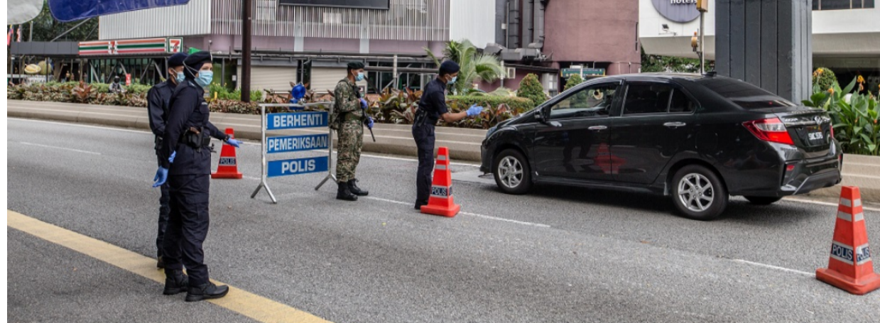
Sekatan jalan raya di Bukit Bintang Kuala Lumpur pada 13 Jan 2021

MCO 2.0 telah dilanjutkan sehingga 18 Februari dengan SOP yang lebih ketat disebabkan oleh kenaikan kes harian sehingga 4 angka. Situasi ini amat membimbangkan, namun kerajaan telah mengumumkan SOP yang baharu untuk Tahun Baru Cina. Walaupun ramai berasa tidak gembira dengan SOP yang telah diperketatkan kerana ia tidak membenarkan mereka untuk bertemu dan menziarahi ahli keluarga sempena perayaan ini tetapi rakyat perlu faham bahawa peraturan sebegini ini diperlukan untuk mengawal kes harian yang semakin meningkat. Oleh itu, ACTnow mendesak orang ramai untuk tetap sabar dan bekerjasama untuk mengawal jangkitan ini!