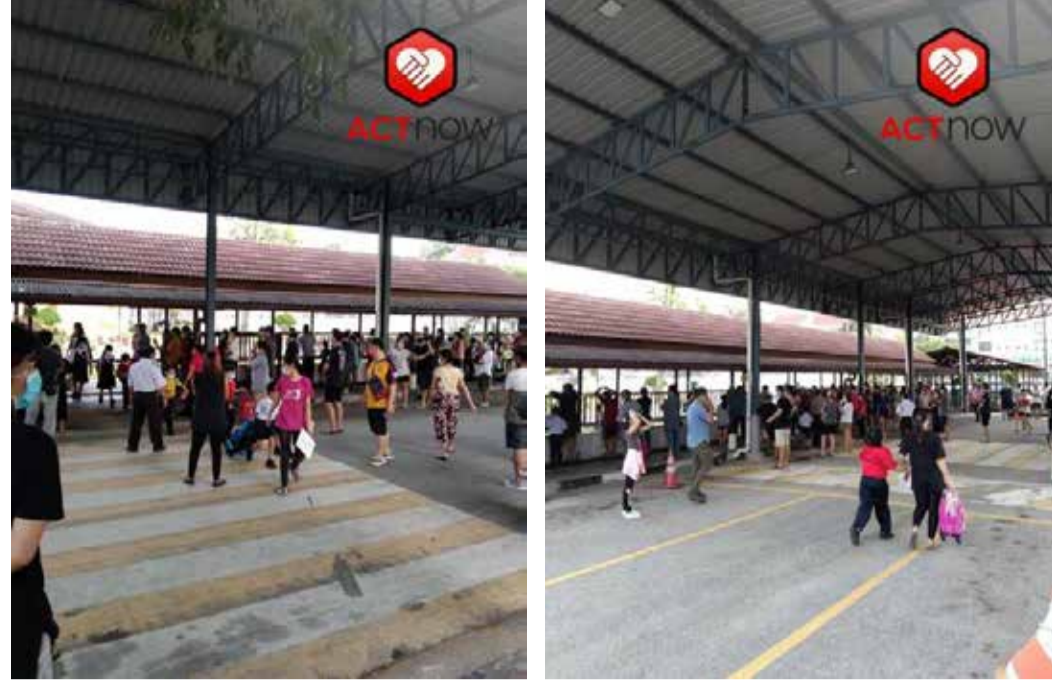
ACTnow投报者发送的照片

在2021年3月11日，ACTnow接获有关雪兰莪Bandar Damai Perdana Cheras，康乐二校国民型华小的防疫标准作业程序问题。在下课时间，家长聚集在学校外没有遵守标准作业程序。投报者非常担心这可能导致出现新感染群。ACTnow已经联系该校校长并自愿协助进行协调和实施标准作业程序，不过遭到了拒绝。最近，投报者告知ACTnow该校已经出现确诊病例。