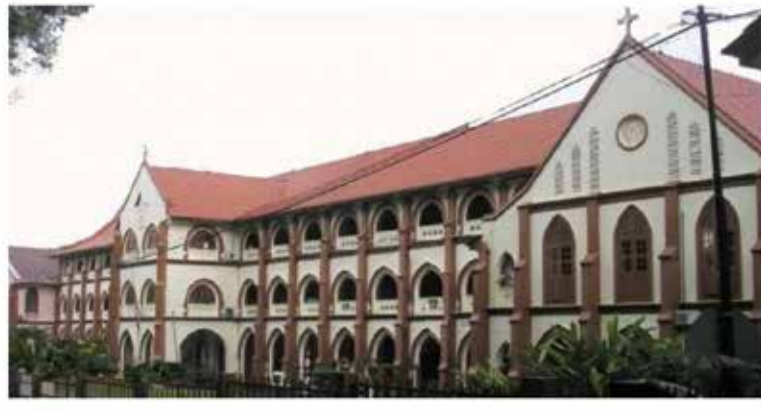
ACTnow.App started this petition to Government

36,535 have signed. Let's get to 50,000!