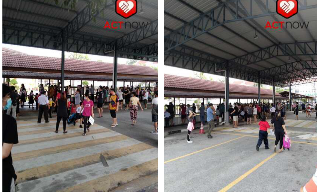
ACTnow ரிப்போர்ட்டர் அனுப்பிய படங்கள்

மார்ச் 11, 2021 அன்று, சிலாங்கூரில் உள்ள பந்தர் டமாய் பெர்தானா சரேலில் எஸ்.ஜே.கே.சி (சி) கொண்ட 2 இல் கோவிட் எஸ்ஓபி காரித்து ACTnow க்கு புகார் செய்யப்பட்டது. எந்தவொரு SOP இல்லாமல் பள்ளி நேரத்திற்குப் பிறகு பற்றேரோக்கள் பள்ளிக்கு வளையே கலிவரவதகை காண மூிந்தது. இது ஒரு பூதிய கிளஸ் டரரை உரவாக்கக்கூடும் என்பதால் இது புகார் செய்தவர்க்கு கவலை அளித்தள்ளது. ACTnow அந்த பள்ளியின் தலைமை ஆசிரியரை தொடர்பு கொண்டு, SOP ஏற்பாடு மற்றும் செயல்படுத்துவதில் தன்னார்வத்துடன் மூண்வந்தது, இரூப்பினும் அது நிராகரிக்கப்பட்டது. சமீபத்தில், இந்த பள்ளியில் கோவிட் தொற்றுநோய் கண்டப்பட்டுள்ளதாக புகார் செய்தவர் ACTnow இடம் தரையிப்படுத்தியுள்ளார்.