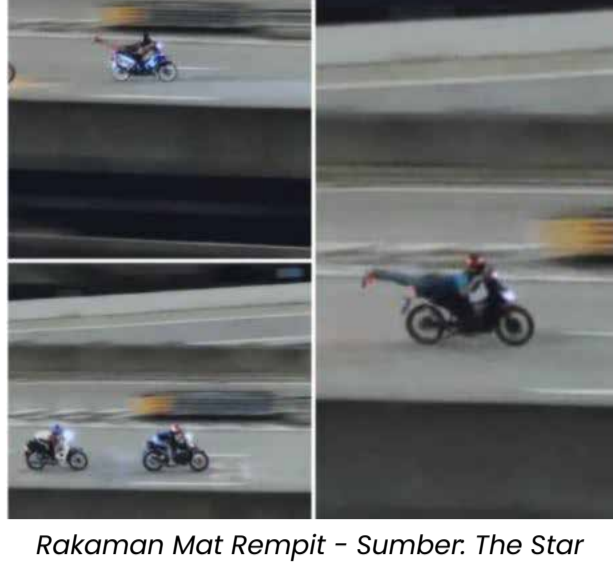
Rakaman Mat Rempit

24 APRIL, KUALA LUMPUR - Lima Mat Rempit ditangkap oleh Jabatan Siasatan dan Trafik Kuala Lumpur (JSPT) semasa operasi Ops Samseng Jalanani bagi melakukan perbuatan berbahaya di Lebuh raya Akleh di Ampang dari jam 1 pagi hingga 4.30 pagi. Kesemua suspek berusia di bawah 18 tahun dan dua daripadanya berumur 15 tahun.