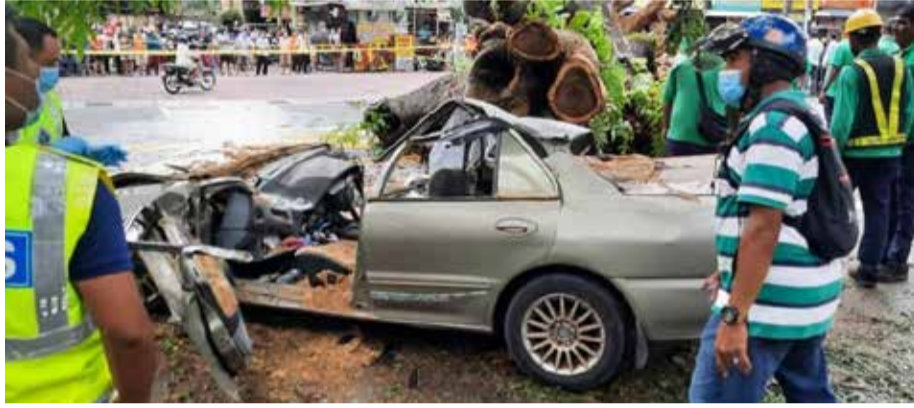
Keadaan kereta selepas kemalangan

Umur rasmi untuk mendapatkan lesen motosikal adalah 16 tahun, yang bermaksud sebahagian atau mungkin semua suspek menunggang tanpa lesen dan pastinya tidak memiliki motosikal. Ibu bapa di rumah tidak wajar membiarkan anak-anak remaja menunggang motosikal mereka untuk mengelakkan kejadian berbahaya ini berlaku. Ibu bapa perlu bersyukur jika anak-anak mereka pulang rumah dengan selamat kerana jika berlaku sebarang kemalangan, mereka berkemungkinan akan kehilangan anak mereka buat selama-lamanya.