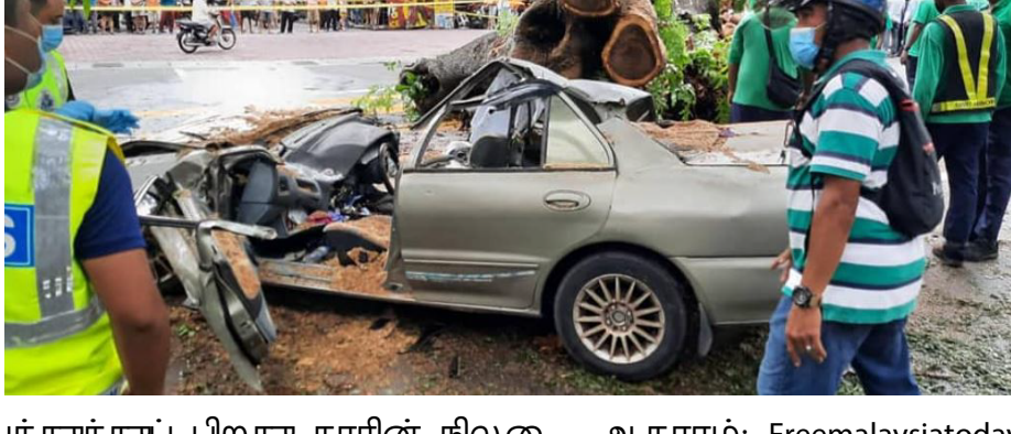
விபத்துக்குப் பிறகு காரின் நிலை

மோட்டார் சைக்கிள் உரிமத்தைப் பெறாதவர்களை அதிகாரப்பூர்வ வயது 16 வயது, அதாவது கதை செய்ப்பட்டவர்கள் அனைவரமே உரிமம் இல்லாமல் மோட்டார் ஓட்டியுள்ளனர், நிச்சயமாக மோட்டார் சைக்கிள்களும் அவர்களிடையேயுள்ள இரக்காது. இந்த ஆபத்தான செயல்கள் நடப்பதைத் தடுக்க, பெற்றோர்கள் தங்கள் பதினம் வயது குழந்தைகளை கண்டிப்பாக வதைத்துக்கொள்ள வேண்டும். அவர்கள் பாதுகாப்பாக வீடு திரும்பும்போது அது அதிர்ஷ்டம், இரூப்பினும் ஏதனும் விபத்துக்கள் நடந்தால், பெற்றோர்கள் தங்கள் குழந்தைகளை இழக்கலாம்.