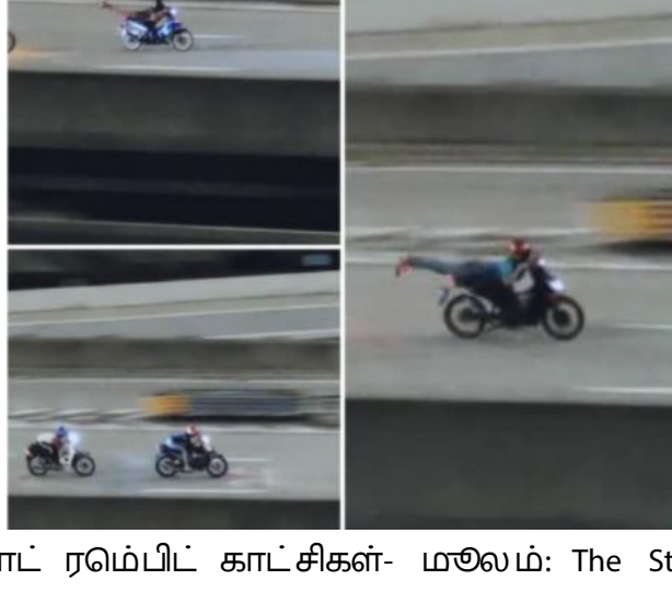
மாட் ரெம்பீட் காட்சிகள்- மலேம்: The Star

ஏப்ரல் 24, கோலாலம்பூர்- கோலாலம்பூர் போக்குவரத்து மற்றும் புலனாய்வுத் துறையின் (ஜே.எஸ்.பி.பி.கே.எஸ்) ஓப்ஸ் சாம்சென் ஜலானின் செயல்பாட்டின் போது, ஆம்பாங்கில் உள்ள அக்லே நடுஞ்சாலையில் அதிகாலம் 1 மணி முதல் அதிகாலம் 4.30 மணி வரை சட்ட விரோத மோட்டர் பந்தயங்கள் நடந்தன. சாலையில் ஆபத்தான செயல்களைச் செய்ததில் ஐந்து மாட் ரெம்பீட் கதை செய்ப்பட்டனர். கதை செய்ப்பட்டவர்கள் அனைவரும் 18 வயதிற்குட்பட்டவர்கள், அவர்களில் இரவர் 15 வயதுடையவர்கள்.