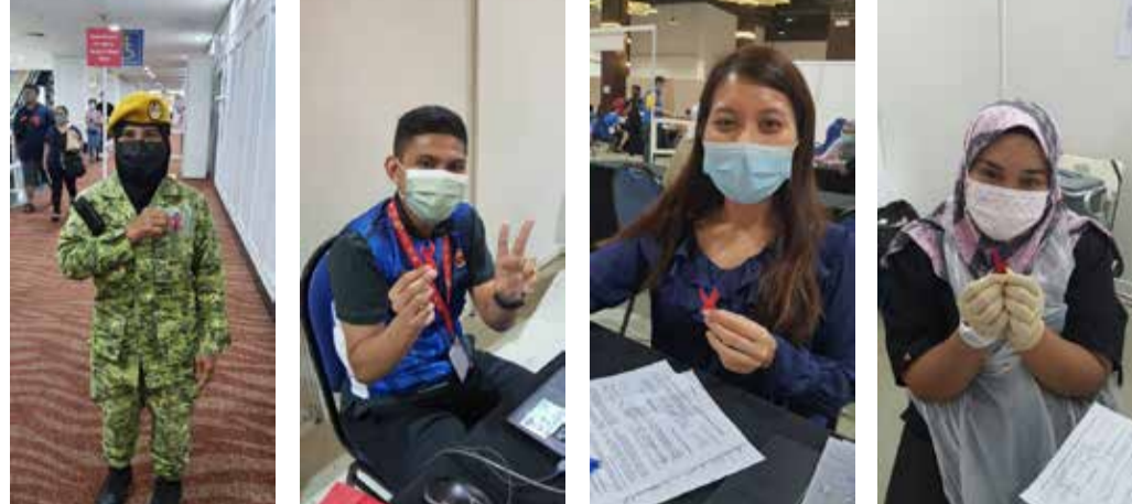
Terima kasih barisan hadapan atas bantuan anda semasa vaksinasi!

Astrazeneca 1.0, sejumlah 268,600 Astrazeneca telah ditempah sepenuhnya dalam masa 3 jam setengah, dan Astrazeneca 2.0 telah pun ditempah sepenuhnya dalam masa 1 jam setengah. Vaksin ini tidak termasuk dalam Program Imunisasi Nasional (NIP) kerana ramai bimbang akan kesan sampingannya walaupun kebarangkaliannya rendah iaitu satu dari setiap 250,000 vaksinasi. Pada 27 May 2021, disebabkan oleh sambutan yang baik, ia telah pun ditambahkan ke dalam program NIP bersama vaksin-vaksin lain.