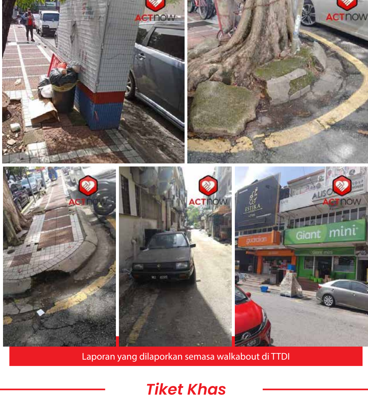
Laporan yang dilaporkan semasa walkabout di TTDI