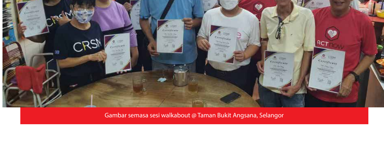
Gambar semasa sesi walkabout @ Taman Bukit Angsana, Selangor